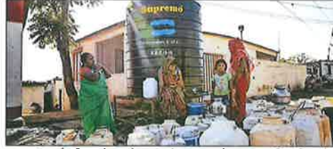
झारखंड और बिहार ने सबसे कम स्कोर 43.95 और 44.47 हासिल किया है

रिपोर्ट के मुताबिक, आइजोल (मिज़ोरम), सोलन (हिमाचल प्रदेश) और शिमला (हिमाचल प्रदेश) सबसे